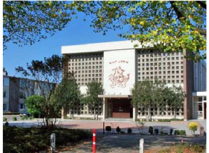
St. Joris parochie